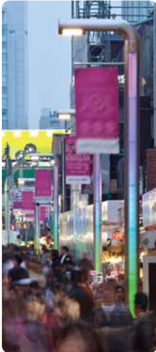
竹下通り 〔東京〕 設計／アーバンデザイナーズ アソシエイテッド