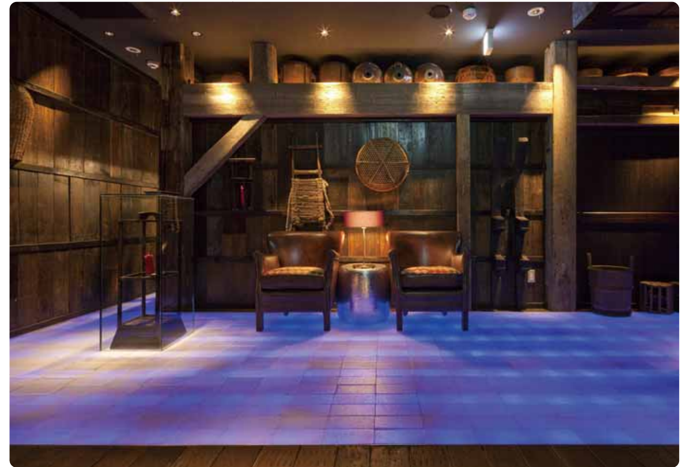
鳥良 上野駅前店 〔東京〕 設計/ビス・アティック