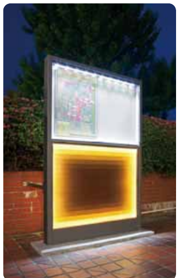
万代シティ 〔新潟〕 設計／アーバンデザイナーズ アソシエイテッド