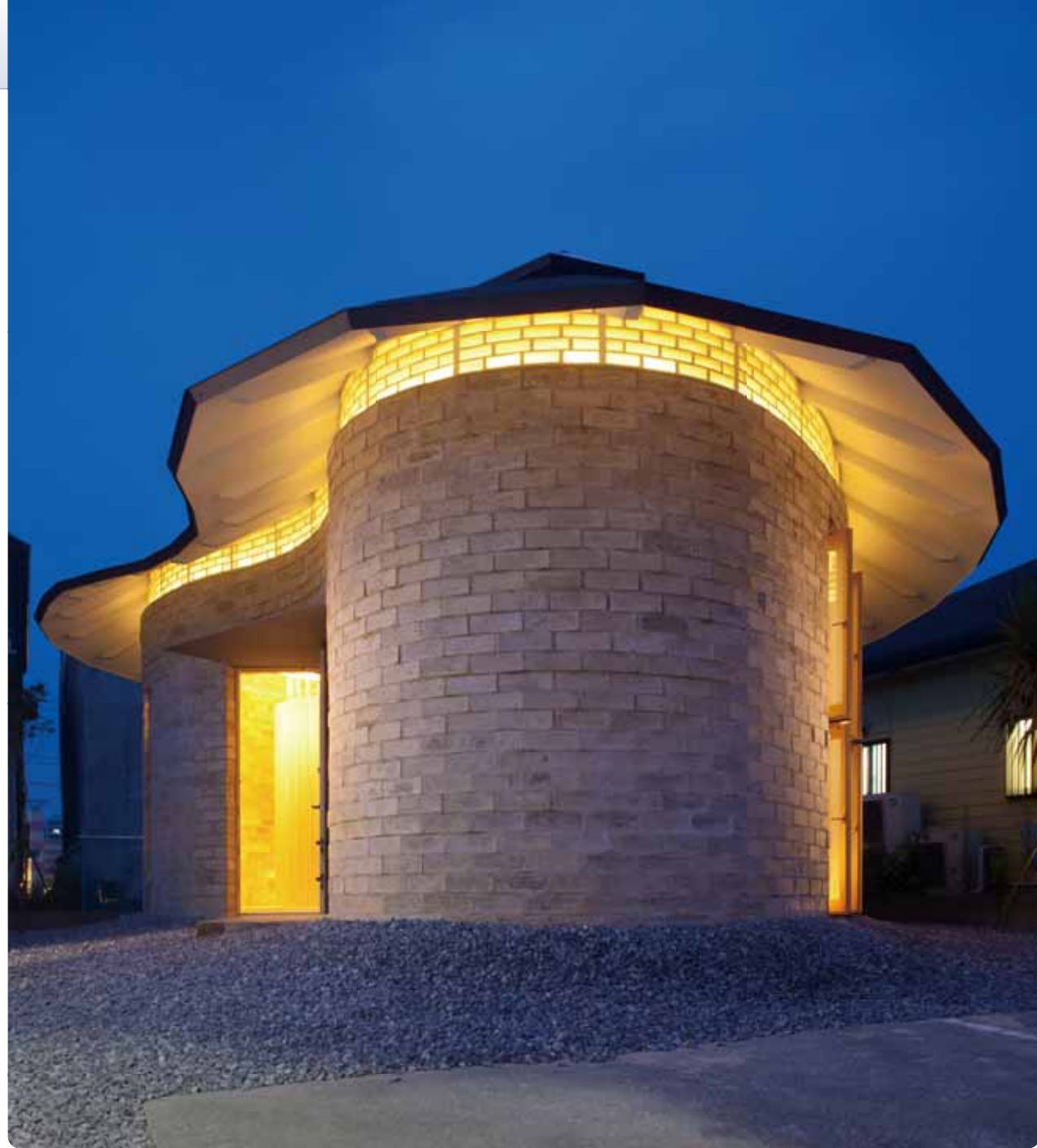
アースブリックス 〔千葉〕 設計/アトリエ・天工人