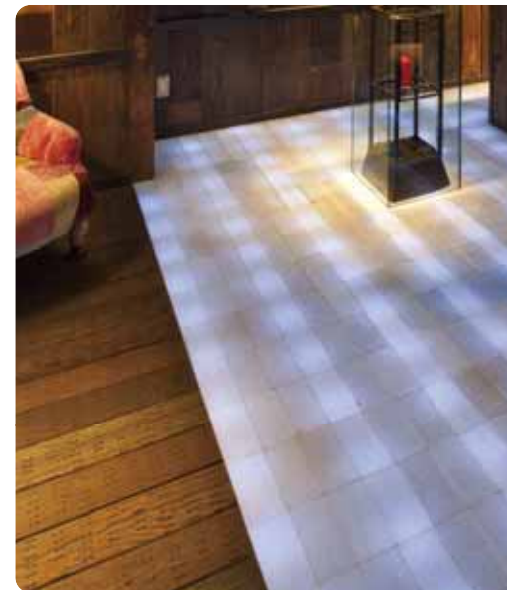
グランド・ハイアット福岡 BAR FIZZ 〔福岡〕 設計/スーパーポテト