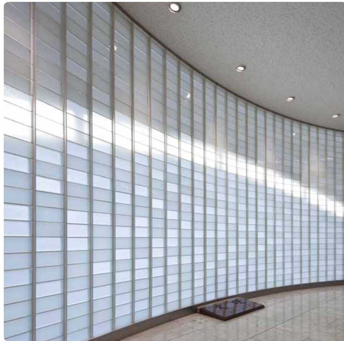
名古屋第二赤十字病院 〔愛知〕 設計/山下設計

粗い表面を持つレンガのような素材感と存在感。半透明のガラス塊を透る、美しく柔らかな光の表情。 ガラスレンガ「グラソア」は、様々なシチュエーションで。アーティスティックな光空間を演出します。