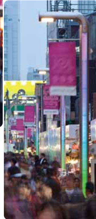
竹下通り 〔東京〕 設計／アーバンデザイナーズ アソシエイテッド