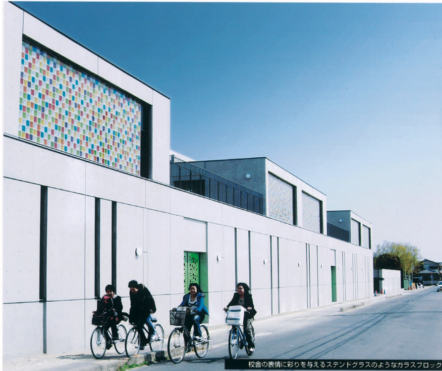
校舎の表情に彩りを与えるステンドグラスのようなガラスブロック