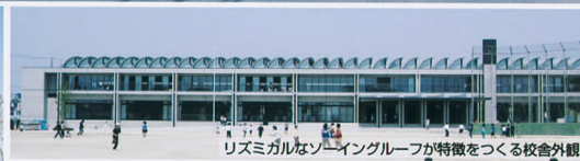
リズムミカルなソーイングルーフが特徴をつくる校舎外観