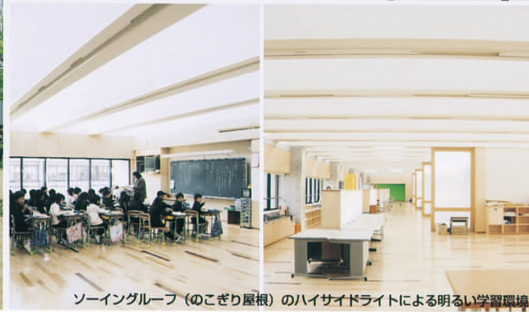
ソーイングルーフ（のこぎり屋根）のハイサイドライトによる明るい学習環境