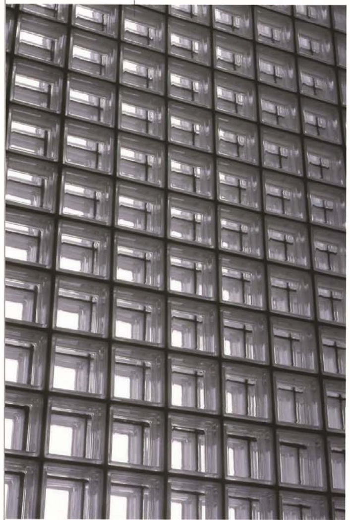
遮音ガラスブロック 190×190×95 (NEG・F) 2重積