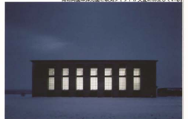
夜明け前の工場 60dBの遮音性能が夜間の工場稼働を可能にしている。