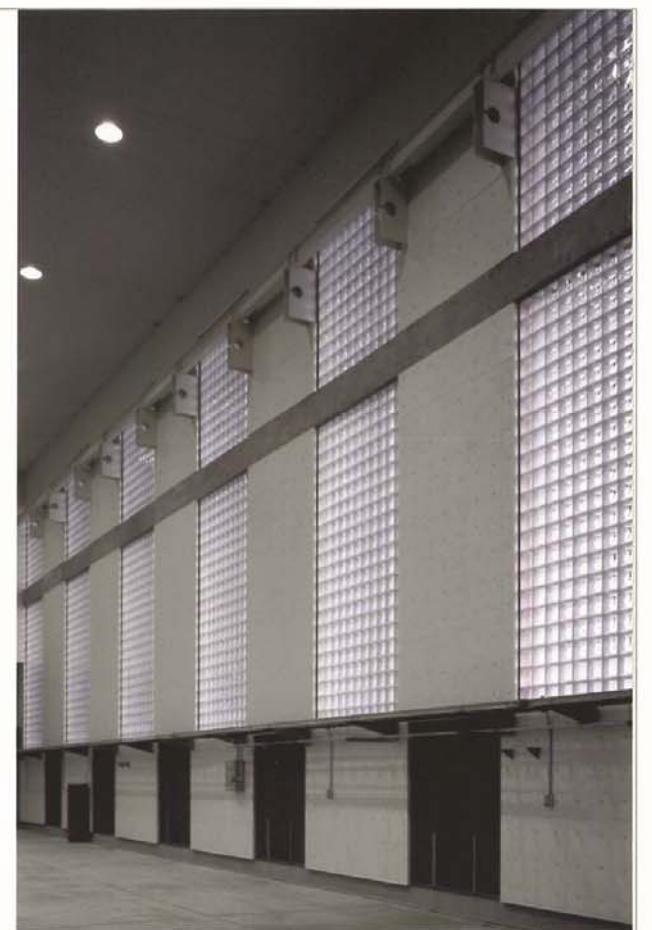
南北両面は採光面と吸気シャフトが交互に林立している。