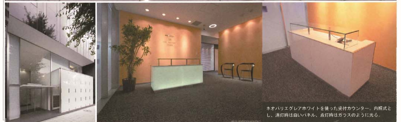
ネオパリエグレアホワイトを使った受付カウンター。内照式とし、消灯時は白いパネル、点灯時はガラスのように光る。