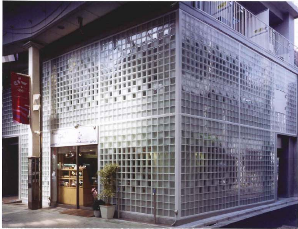
枠内に写真を貼付してください。