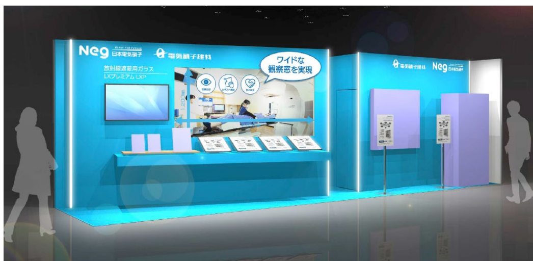
当社ブースイメージ

当社は本展示会において、薬品の飛散や水拭きなどによるくもり(ヤケ)が発生せず、合わせガラスならではの衝撃安全性を備えたカバーガラス付き放射線遮蔽用ガラス<LXプレミアム>を中心に製品展示します。