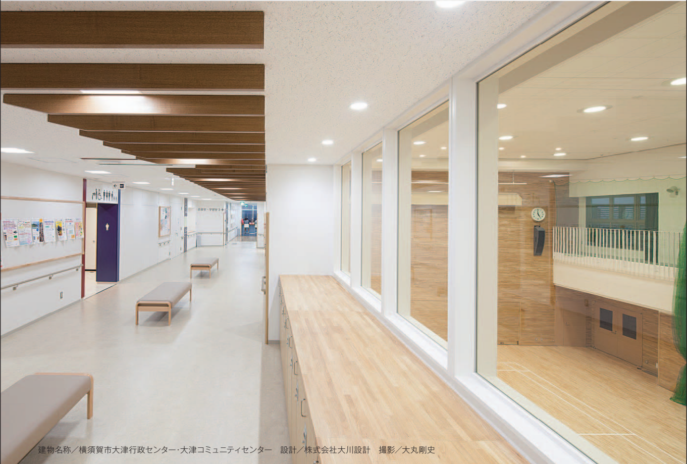
建物名称/横須賀市大津行政センター・大津コミュニティセンター 設計/株式会社大川設計